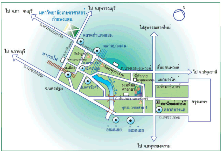
แผนที่การเดินทางมามหาวิทยาลัยเกษตรศาสตร์ วิทยาเขตกำแพงแสน